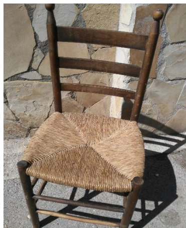
Cadira de boga del fons del GRC

Les fulles de boga s'empren, una vegada assecades i parcialment descolorides amb vapors de sofre, per a fer seients de cadira, estores, cistelles i altres objectes. El trençat de la boga requereix una gran destresa manual. Hi ha diferents classes de cadires de boga: costurera, xata, catalana, castellana, xaparra