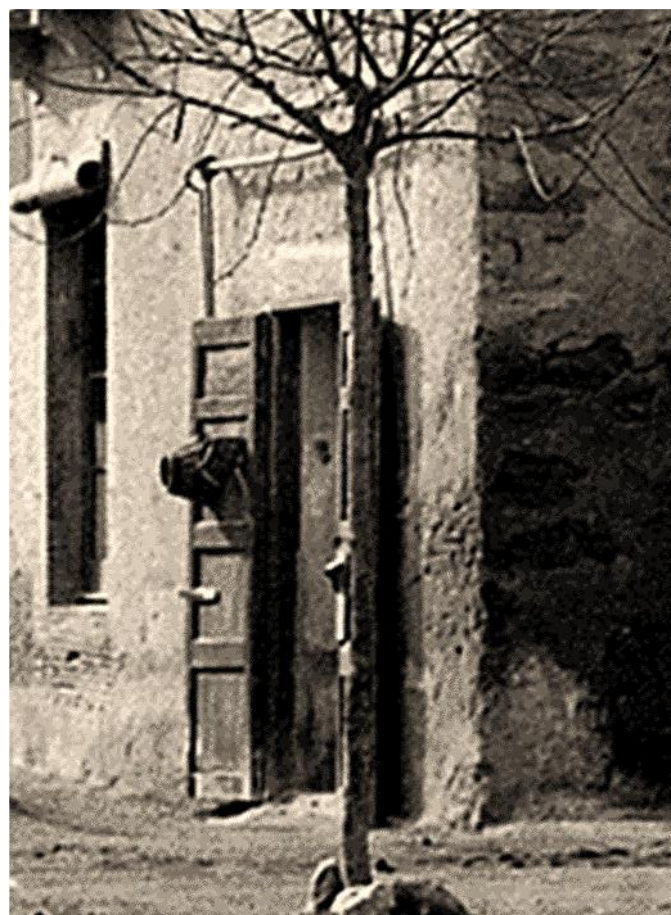
Ca l'antic cisteller