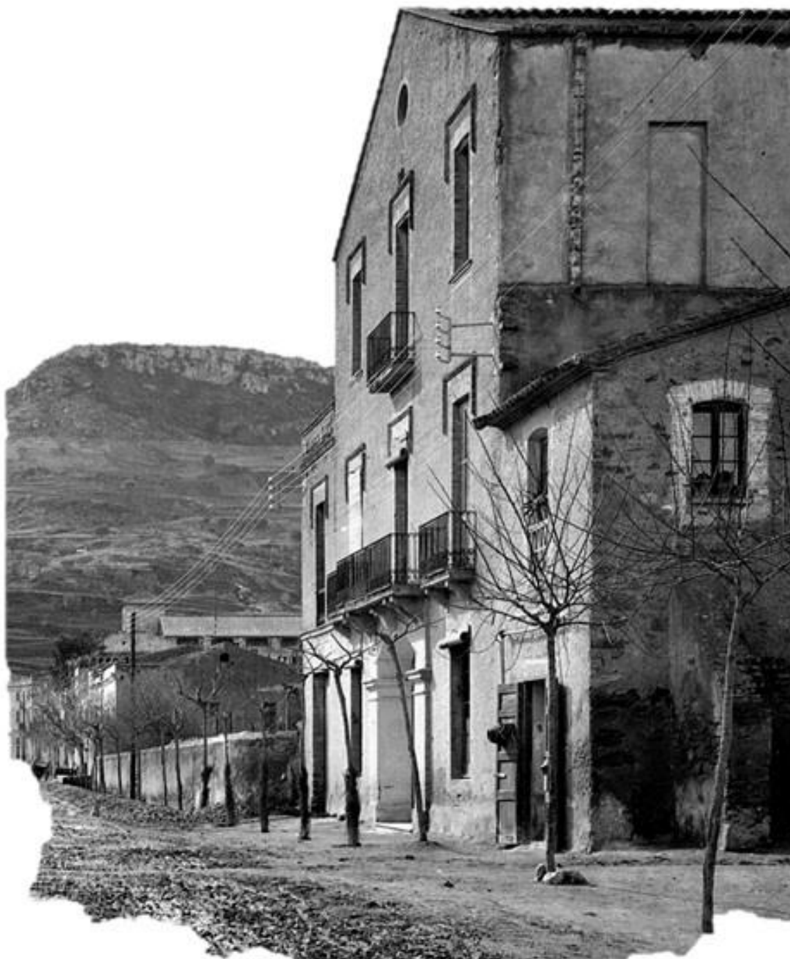
Ca l'antic cisteller a Can Guitart, amb uns cistells al portal