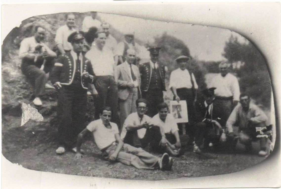
Fotografia de la celebració que es va fer, quan van acabar la teulada de la vil·la Casilda: un arròs a la riera.